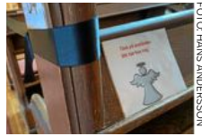
Kyrkbänk i Sofia kyrka.